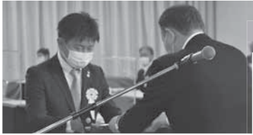
▲会員ニーズを踏まえて、サービスを充実するとともに、会員数の維持、増強に努めます