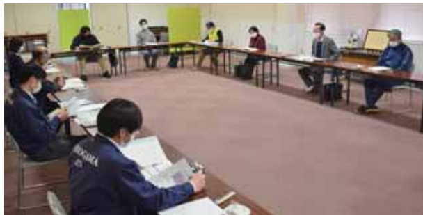
▲委嘱状を交付の後、情報交換をしました