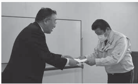
▲各部会等の意見を踏まえ、塩釜市など、関係機関への要望活動を行います

▼宮城県商工会議所連合会などを通して、制度的な課題を行政施策に反映させるよう努めます