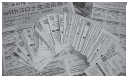
▲コロナ禍にあっても、塩竈の魅力さをさらに発信します

塩竈の特性を活かした産業活動や食分野と結びつけた商業・観光資源を地域ブランドとして情報発信します。地域活性化に繋がる活動を行い、塩竈の魅力さをさらに高める事業を展開します。