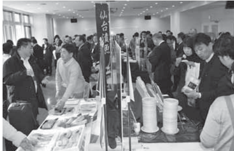
▲塩釜フード見本市の開催など、地場製品の販路開拓、拡大に向けた事業を行います

国の認定を受けた「経営発達支援計画」に基づき、伴走型支援を充実するため巡回相談を強化します。また、コロナを契機にICT（情報通信技術）やテレワークなど、専門的な相談にも対応できるよう、関係機関と連携しながら会員の方々が求める課題解決のための各種サポート事業を行います。