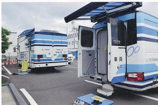
▲胸部、胃部レントゲンは、それぞれ2台の健診バスで行います

受診者の方々からは、「年1回は自分の体の状態を知ることが大事ですね」「健診の時期を体のメンテナンスの機会にしています」という声があり、健