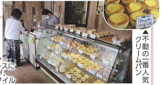
ガラスケースに並ぶパンが、麦の穂スタイル