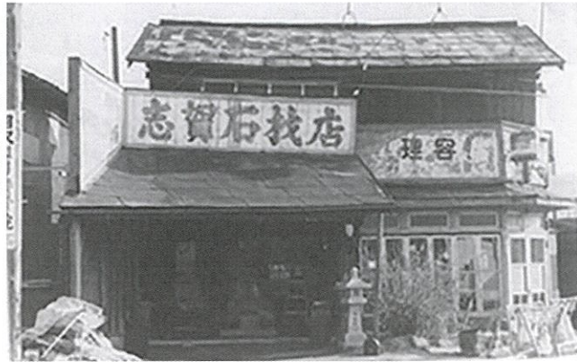
▶創業当時の店舗です

こうして受け継いできた技と信頼が、今日の礎となっております。現在は五代目である息子へと事業をつなぎ、新たな供養のあり方を模索しながら、時