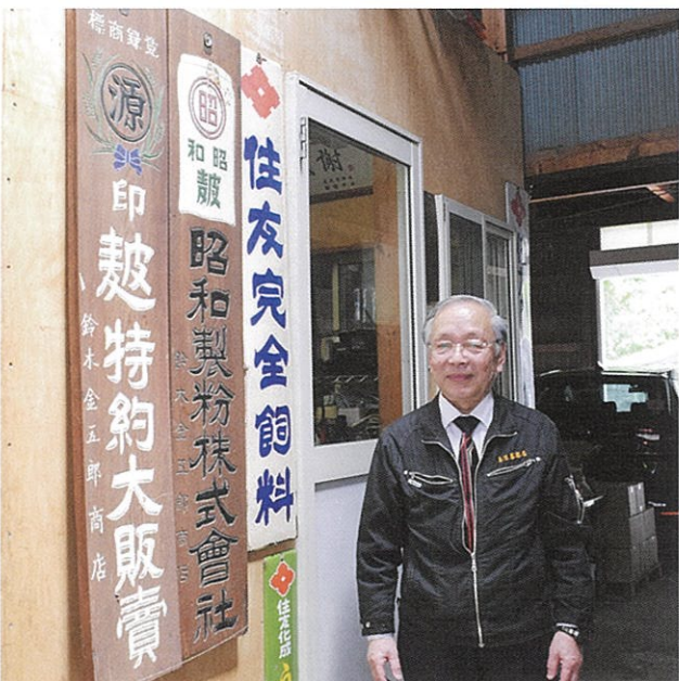
▼創業当時から掲げていた看板は店の歴史の象徴です

塩竈にはとても良い要素がたくさんあります。私たちの「まちの将来」を改めて考えてみてはいかがでしょうか。