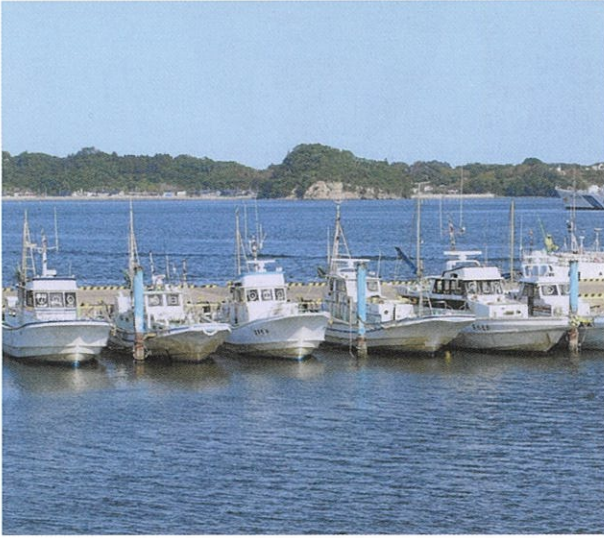
▲現在、7隻の船を所有しています

東北初の営業釣船。 海の魅力を伝え続ける三代が、塩竈の海とともに歩んできました。