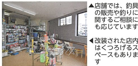
▲店舗では、釣具の販売や釣りに関するご相談にも応じています ▲改装された店内はくつろげるスペースもあります