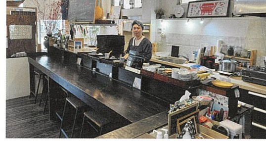
住所：本町 2-10 しおがまパノラマ内

れています。自分自身が心から美味しいと感じたものだけを提供することを大切に、日々食材探しにも力を入れています。