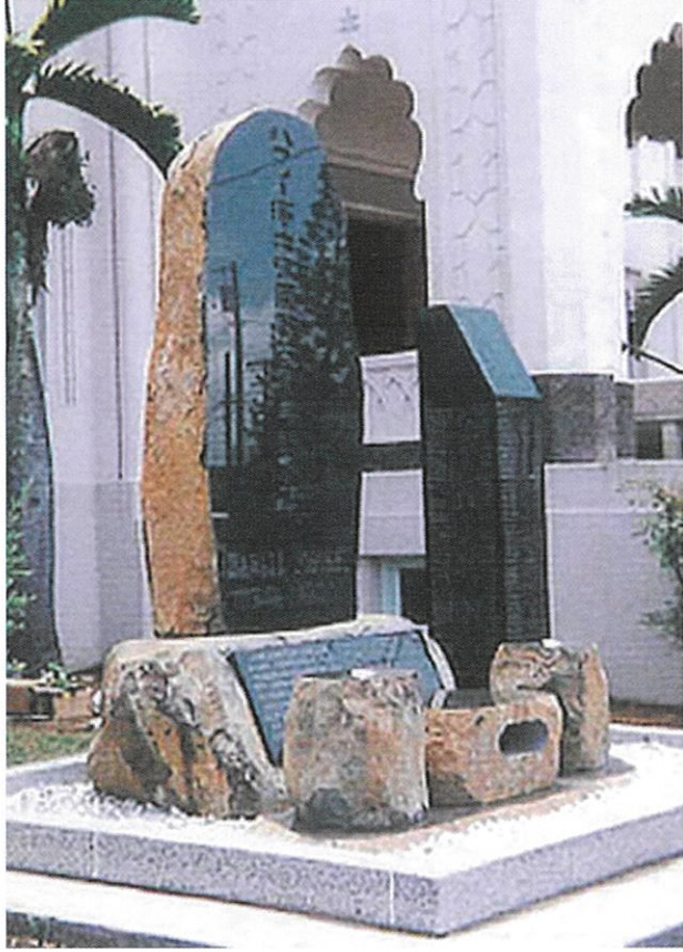
▲ハワイ州オアフ島に記念碑を建立しました

伝統を守りつつも変化を恐れず、地域に必要とされる存在であり続けるため、社員一丸となって歩み続けてまいります。