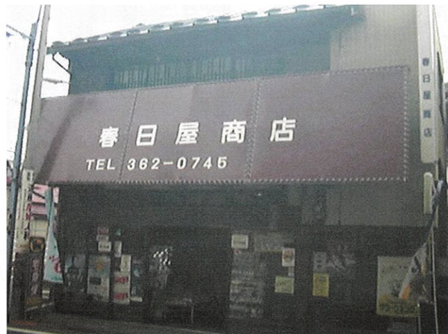
▶東日本大震災で被災した店舗

まちへの思いは、さまざまにあります。商業活性化の取り組みで、塩竈商品券事業の創設に関わり、運用の