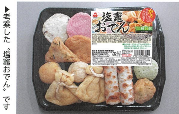
▶考案した「塩竈おでん」です

鉾など、多彩な魅力が揃っています。これらを組み合わせる企画をすることで、塩竈ならではのまちの魅力を、より深く体感していただけたらと思います。そうした取り組みを通じて、多くの観光客が訪れるまちになるのではないかと考えております。