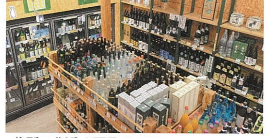
住所：北浜 4 丁目 8-20

Q 貴店の創業について教えてください。 相原酒店の始まりは、祖母・相原タカが創業した「タカ商店」です。当時は、藤倉や北浜にお住まいの方々に利用していただく地域の個人商店でした。