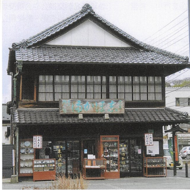
▲建物は、大正3年（1914年）に建てられ、国の登録有形文化財に指定されています

鹽竈神社の門前町で三百年以上にわたり暖簾を守り続ける丹六園。 銘菓「志ほか満」とともに受け継がれてきたのは、訪れる人を温かく迎えるおもてなしの心です。