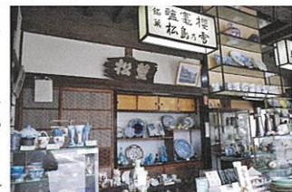
▲陶器や茶器も取り扱っている店内には、仙台藩五代藩主・伊達吉村公の自筆による「望松」の文字が掲げられています