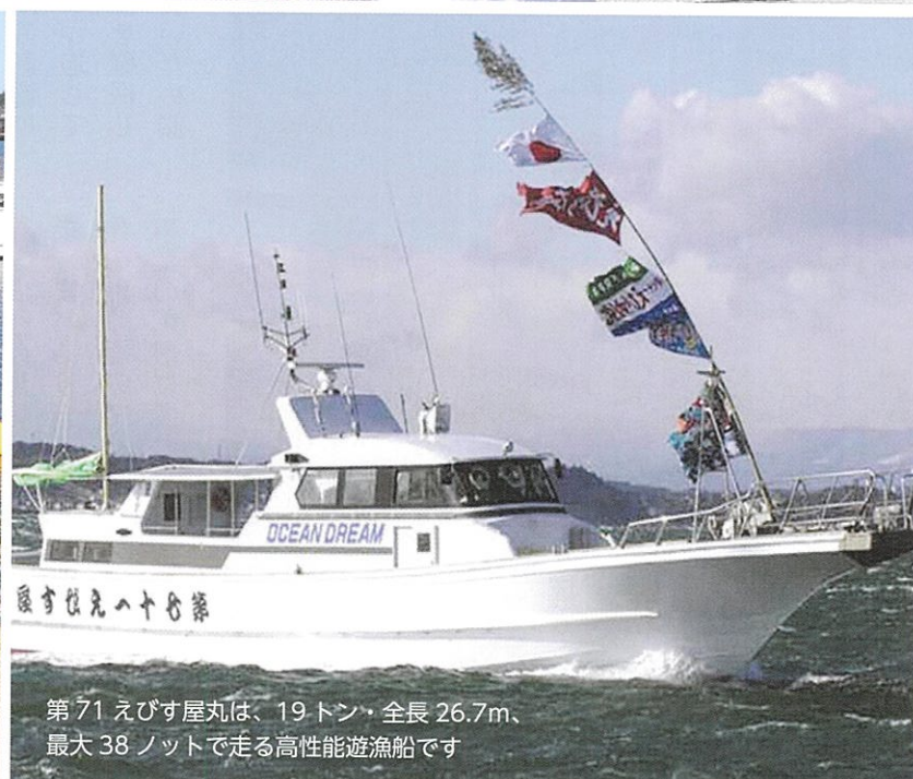
第71 えびす屋丸は、19トン・全長26.7m、 最大38ノットで走る高性能遊漁船です