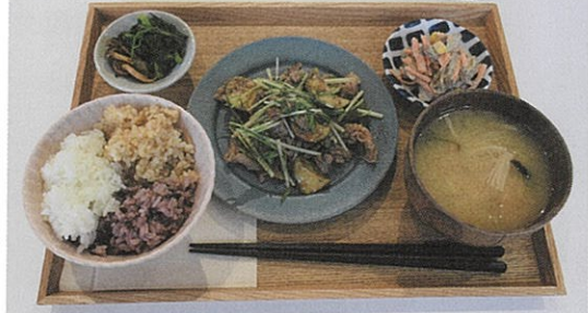
住所：東玉川町 9-18 マーケットアパートメント塩釜 1-A 号

Q これまでどのようなことに挑戦されてきましたか。 塩竈はアートの特化しているまちだと思います。芸術に触れられる場を創りたいと思い、個展のギャラリートとして、学生やフリーのアーティストの方々へ店内を使っていたり、取組みをしています。また、音楽会を企画作っています。