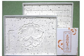
▲塩竈を代表する銘菓「志ほか満」鹽竈ザクラの紋が押されています

江戸時代、廻船問屋として創業した丹六園は、その後、お茶と茶道具を扱い、昭和二十五年には伊達家御用菓子商「古梅園」の銘菓「志ほか満」を復元しました。もち米と藻塩と青紫蘇を使った軟落雁は、今も一枚一枚丁寧に心をこめて作り続けています。 駅の移転や観光形態の変化、門前町の環境変化など、「時代の波