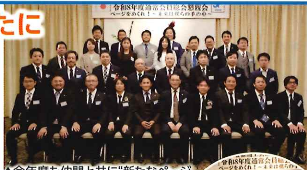
▲今年度も仲間と共に“新たなページをめくって”いきます！

さらに、卒業時期を迎えた会員へのセレモニーも行われました。これまでの青年部活動への感謝を伝えるとともに、現役の会員はさらなる団結を深める機会となりました。