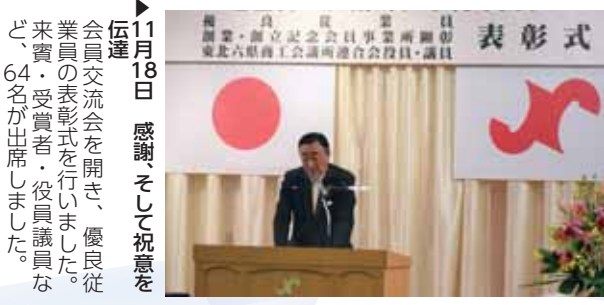
▶11月18日 感謝として祝意を伝達 役員交流会を開き、優良従業員表彰式を行いました。来賓・受賞者・役員議員など、64名が出席しました。