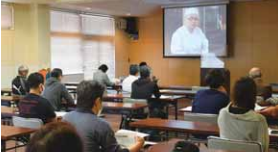
▲HACCAPと接客を学びました 5月18日、オンラインで若手社員の接客セミナーを開催しました。また20日は6月から義務化される衛生管理のセミナーを行いました。