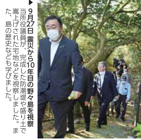
▶9月27日 震災から10年目の野々島を視察 当所役員が、完成した防潮堤や盛り土で嵩上げされた宅地などを視察しました。また、島の歴史なども学びました。