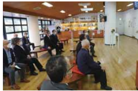
▲11月2日 こだわりの企業運営を学びました 役員員の研修会を開催し、ミュージアム運営や日本酒大学などを実施する「(株)ノ蔵」を視察しました。こだわりの酒造りや、地域の子供たちに向けての社会貢献活動などを学びました。