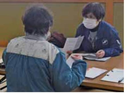
▲2月8日・17日 浦戸地区で移動相談所 浦戸地区で移動相談所を開設しました。確定申告に向けた税務相談で、10名が訪れました。