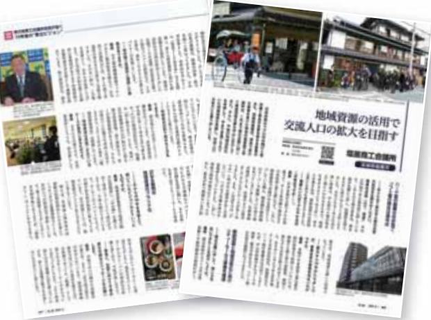
▲3月 当所が日商の「石垣」に 東日本大震災から10年の特集に、被災地区商工会議所として当所が取り上げられました。