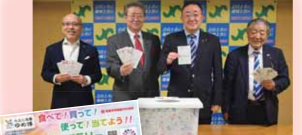
▲9月1日～ 大好評、ゆめ博スタンプラリー 2回の抽選を目指し、去年を上回るはがきが届きました。参加店も164店舗となりました。