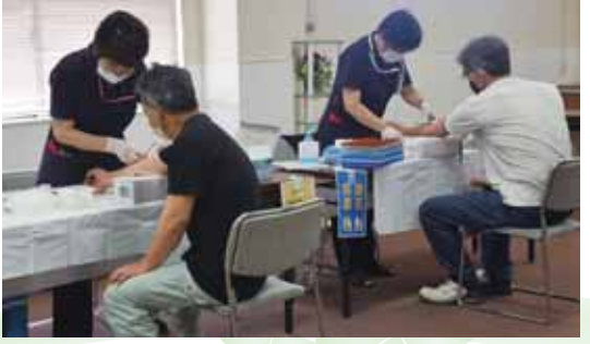
▲6月28～30日 健康経営は健診から 生活習慣病健診では、123名が受診しました。健康経営の基本はまず健診ですね。