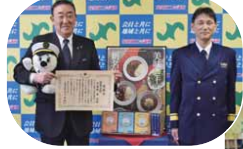
3月25日 海保カレーに感謝状 海上保安庁の認知度向上へ貢献したことに感謝状を頂きました。海保カレーは学校給食や、せんべいやクッキーなどでも味わっていただけのようにになりました。