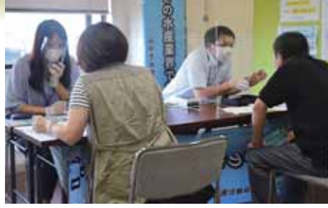
▶8月25日 求職求人マッチング、合同説明会を開催 当所の人手不足対策委員会が「宮城シフトサポーター(石巻市)」と共催で、企業説明会を開催しました。求職者は各ブースで熱心に説明を聞いていました。