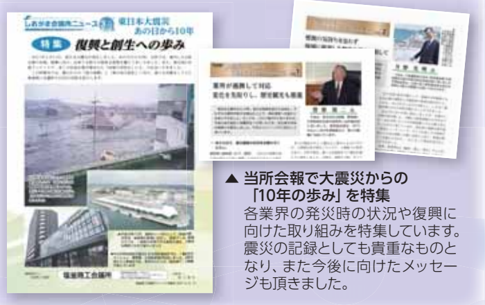
▲当所会報で大震災からの「10年の歩み」を特集 各業界の発災時の状況や復興に向けた取り組みを特集しています。震災の記録としても貴重なものとなり、また今後に向けたメッセージも頂きました。