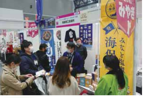
▲3月10日 ビジネスマッチで商機を拡大 夢メッセで開催された展示商談会に当所会員も出展しました。リアルとオンラインで商社や流通業者にPRしました。