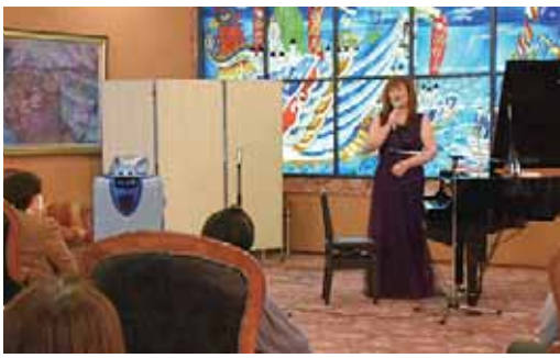
▲3月3日 女性会がコロナ禍をいやす集い ピアノ演奏会が開かれ、心がいやされるひとときとなりました。