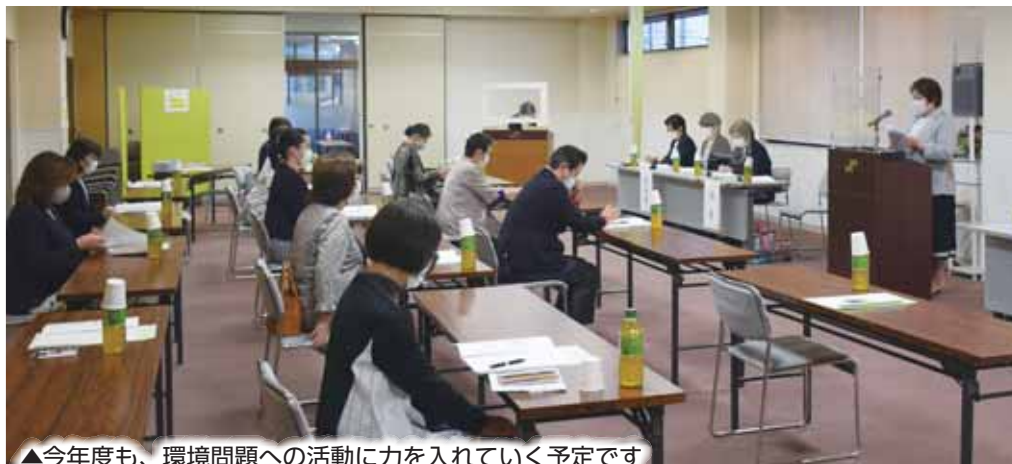
▲今年度も、環境問題への活動に力を入れていく予定です