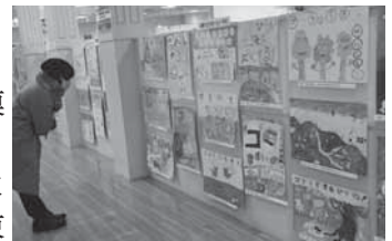
▲作文絵画コンクールは今年も開催します

コロナ禍の中、規模を縮小した開催となりましたが、久しぶりに会員が集い、より結束を強くするものとなりました。