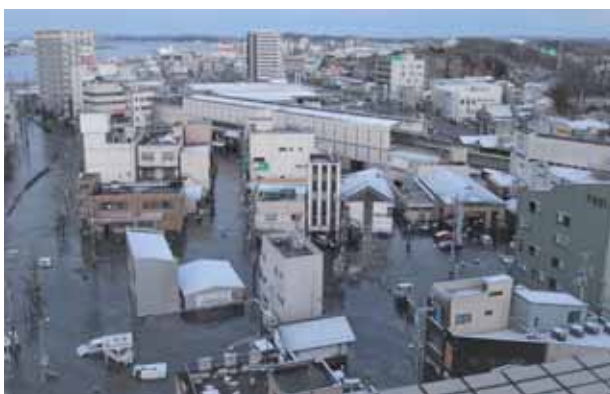
▲2011年3月11日東日本大震災津波直後の市内海岸通の様子。一帯が水没していました

寿司店で構成しています。その上部組織が宮城県寿司商生活衛生同業組合です。この県の組合が、組合員の安否確認や義援金の申請、風評被害対策などの復旧、復興に向けた活動の中核となりました。