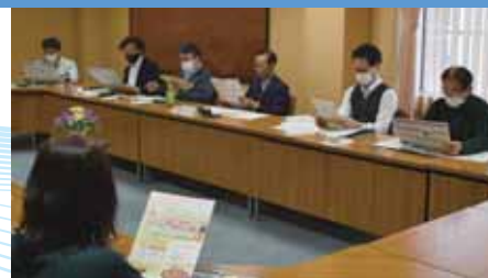
▲出席した委員から各業界の課題や意見が多く出されました

連絡会議では、事務局からスタンプラリー事業や商品券事業、補助金制度、コロナウイルス感染症に関連する支援情報について説明し、周知協力を依頼しました。また、出席した9名の振興委員からは、それぞれの業界の現状、コロナウイルス感染症拡大に伴う影響についてお話いただきました。「事業所では様々な感染予防対策を行っている。事業所負担が大きい」「仕入価格の上昇に加え、発送料など負担も増加し、利益を圧迫している」「工事関係も動き始めたが鉄鋼製品の価格が上昇し、対応に苦慮している」「コロナ禍での最低賃金アップは、価格に