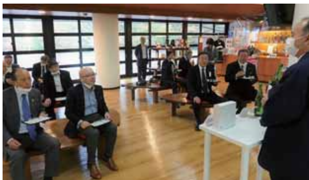
▲見学を終え、一ノ蔵こだわりの銘柄を試飲しました