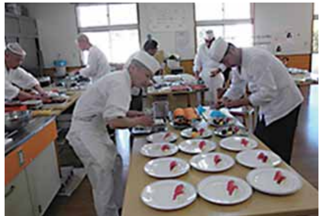
▲福祉施設慰問時の様子。握りから盛り付けまで組合員が協力して仕上げています。(コロナ禍で現在は行われていません)

白幡氏 時代の流れの中でライフスタイルは変化し、回転寿司や宅配寿司店の出店も相次いでいます。スーパーやコンビニでも気軽に惣菜寿司が買え