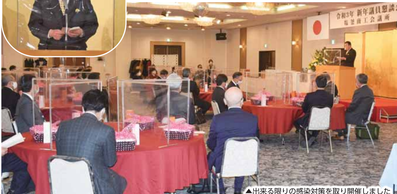
▲出来る限りの感染対策を取り開催しました

1月5日、ホテルグランドパレス塩釜で、令和3年新年議員懇談会を開催しました。当所では、昭和55年から「新年賀詞交歓会」を開いてきました。しかし、今回はコロナ感染防止のため、規模を縮小し、議員懇談会として行いました。飲食はなし、時間は短縮し、消毒、検温など、コロナ対策をしっかりとった上で実施しました。