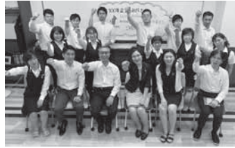
▲社員一同で、DX・オンライン化を通じ社会に貢献していきます!!

昨年からの新型コロナウイルス感染拡大によるピンチを、「チャンスに変えたい」、その思いから当社では、テレワークの推進やDX(デジタルトランスフォーメーション)企業とコラボレーションしたオンラインセミナーやオンライン採用をいち早く進めてきました。更にYoutube動画撮影、編集、広報活動に取組み、DX・オンライン化のノウハウを蓄積しました。