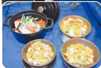
▲出展された商品を活かした新メニューを披露した「しおがま屋」。創作メニューの数々に、高好評をいただきました。