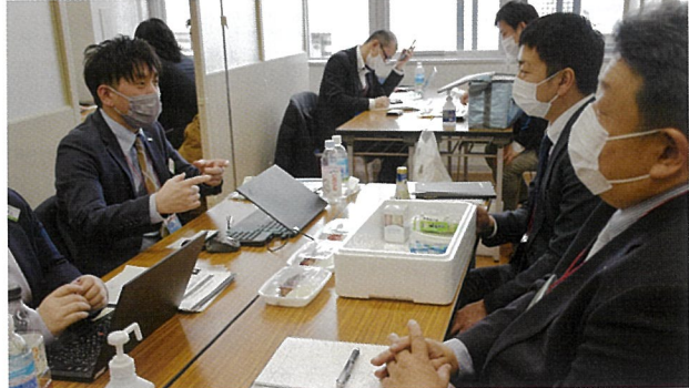
▲前回の成約率は23%と高い評価となりました。今年は展示商談ブースを拡充し、塩竈ブランドを売り込みます

今年も“塩竈ブランド”をPRするため、「2025塩釜フード見本市」を開催します。こだわりの食品をそろえた地元企業22社が出展します。前回は、県内外の流通、販売、外食・ホテル関係者など、1,000名を超える方が来場しました。今年も塩竈市魚市場で開催します。ぜひ、塩竈の逸品をご覧ください。