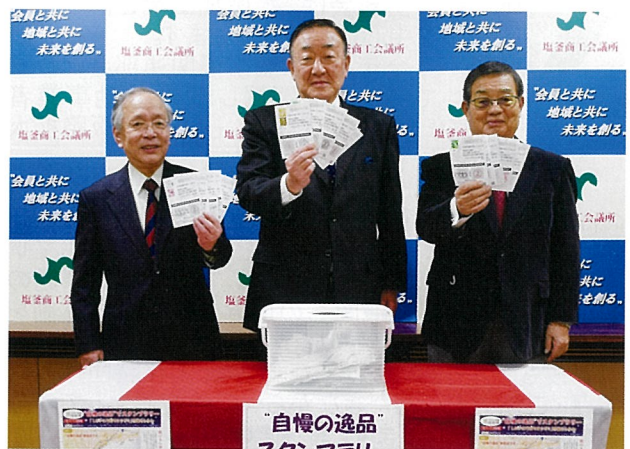
▲当選された皆さんには、クリスマス迄に賞品が届けられました

スタンプラリーは、会員事業所から申し込みのあった“自慢の逸品”55商品を巡りながら、街歩きを楽しんでいただく企画で、10月11日から11月30日まで実施しました。2店舗分のスタンプで応募でき、博物館など4カ所の施設と、本町まちづくり研究会のまちゼミ開催店にも参加いただきました。“自慢