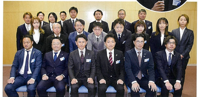
▲まちににぎわいを創出する事業などが期待されます