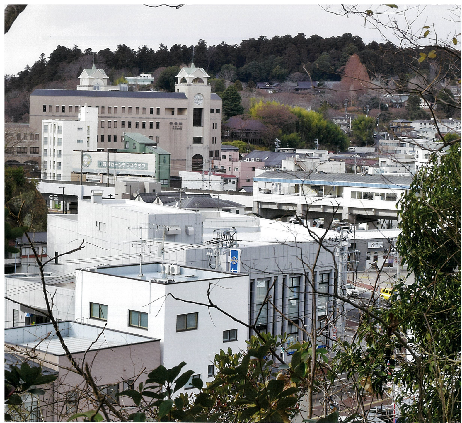
(2024年12月27日撮影 尾島ケ崎護防稲荷神社から)

この上を高架化された仙石線が走っています。1925年の国勢調査人口は1万6871人で、1995年には6万3566人となりました。