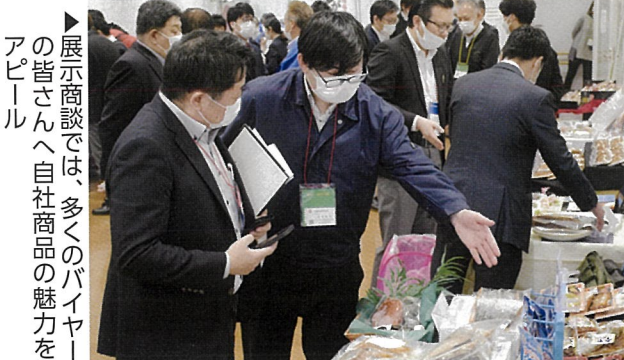
▶展示商談では、多くのバイヤーの皆さんへ自社商品の魅力をアピール

◆日時 令和7年2月5日(水) 午前10時～午後4時 ◆場所 塩竈市魚市場 2F中央棟