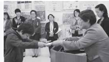
◀ 昨年度の活動の様子「作文・絵画コンクール」