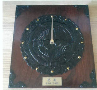
◀『感謝』の銘板を貼り付けた「仙台筆筒時計」。当所会員企業が製作しています