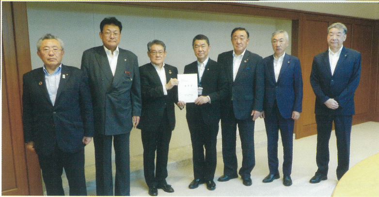
▲桑原会頭からは、直会横丁に対する支援のほか、水産業や港湾に関する要望を行いました