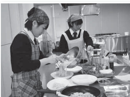
▲手順を確認しながら調理する塩釜高校の皆さん