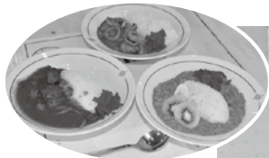
▲▶ 昨年4月、海保カレーによる地域活性化事業がスタートしました

新春にあたり、謹んでご挨拶を申し上げます。 昨年、5年目となった「みなと塩竈ゆめ博」に加え、新たに「海保カレー」による交流人口の拡大とシティセールス活動に鋭意取り組んできました。実施にあたりましては、塩竈市をはじめ、多くの会員事業所の皆様のご協力をいただきました。この場をお借りして、改めて感謝を申し上げます。