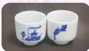
◀今年は、鹽竈ロゴと御座船「龍鳳丸」のイラストが描かれたお猪口で乾杯しました