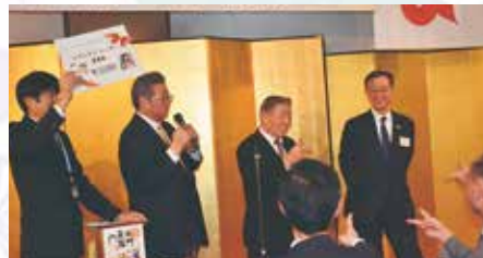
▲恒例の「初春抽選会」では、会員企業32社からの協賛もあり、たくさんの方の参加者に初春の福をお届けしました