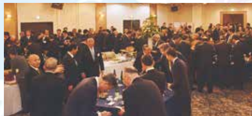
▲多くの参加者であふれんばかりとなった会場では、皆さんそれぞれに年頭のあいさつを交わしていました