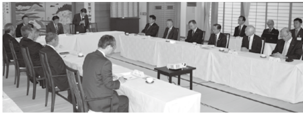
▲挨拶をする鎌田県連会長（中央）。「年に一度、一同に会するこの機会を有意義なものにしましょう」と挨拶がありました

くりへの挑戦～塩竈を変えたい～」をテーマに、講話をいただきました。佐藤市長からは、「人口減少が続く中、生き残るためには民間と連携していくことが必要となる。新しい発想で民間の力を取り入れるため、“公民連携デスク”を新設する。市民の声を聞き、市政の見える化をすすめたい。また、未来を担う子供たちが、郷土愛を育める施策も重要と考えている」と話がありました。