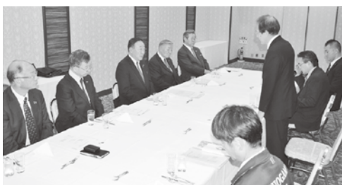
桑原会頭から要望書を手渡しました