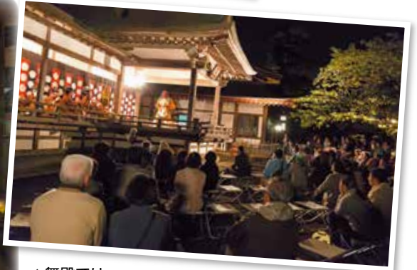
▲舞殿では、雅楽や舞が披露され、ゆらめく灯りとともに幽玄な世界が広がりました