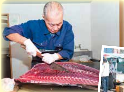
▲▶毎年好評のマグロの解体・即売をはじめ、カキ汁や地元物産品の販売が行われ、多くの来場者でにぎわっていました