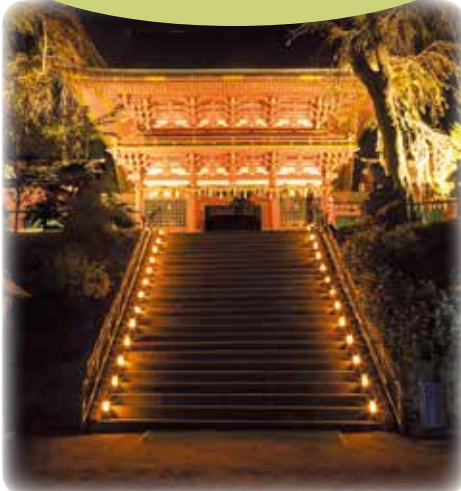
▲LEDキャンドルの灯りに照らされた石段とライトアップされた楼門。幻想的な世界を演出しました