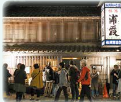
◀▶酒蔵名が入ったグラス付きのチケットを購入し、地酒の試飲ができる「酒蔵めぐり」。どの会場も行列ができるほどの盛況でした