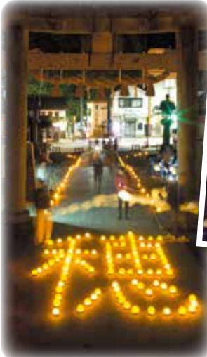
▲表坂下には、「穂」の文字が浮かびました