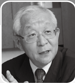
政治ジャーナリスト 田崎史郎氏