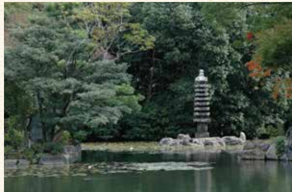
源融公、塩竈ゆかりの名物・景物が伝えられている 「涉成園」(京都市下京区)