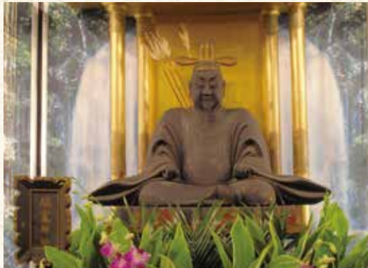
「本覚寺」に伝わる「源融像」