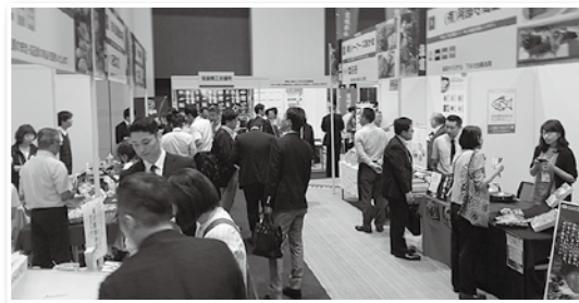
◀ 塩釜からは15社が出展。全国から5,450名が来場しました。

当日は、展示ブースの商談のみならず、個別商談や海外バイヤーとの商談も行われました。また、会