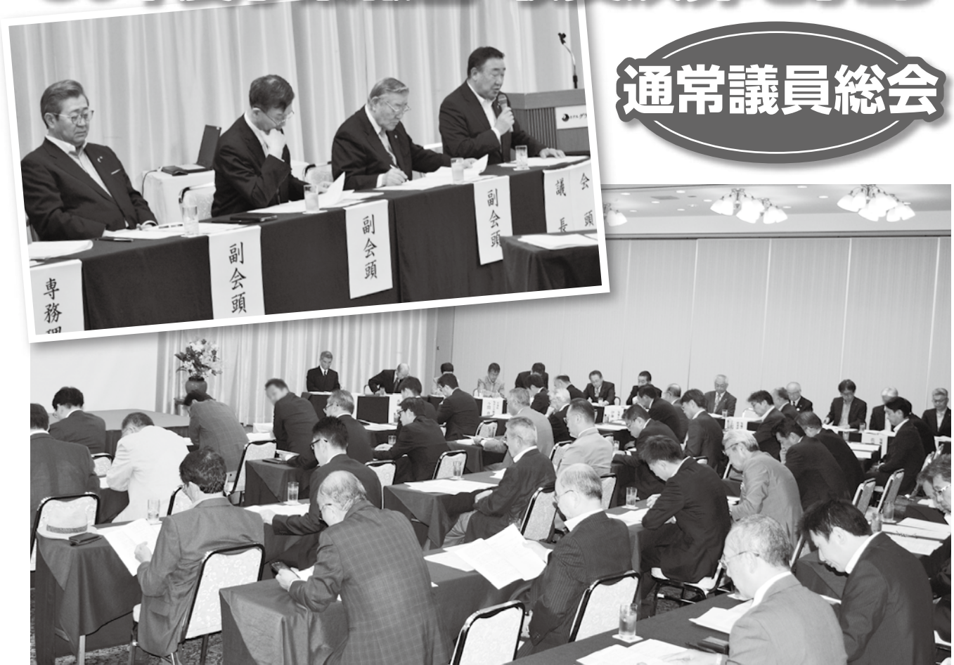
▲桑原会頭から「会員企業の経営基盤の充実と地域の活性化に貢献するよう、全力を挙げて取り組みます」とあいさつがありました

6月26日、ホテルグランドパレス塩釜で令和元年度通常議員総会を開催しました。来賓、役員・議員など62名が出席し、30年度事業報告・収支決算について審議をしていただきました。