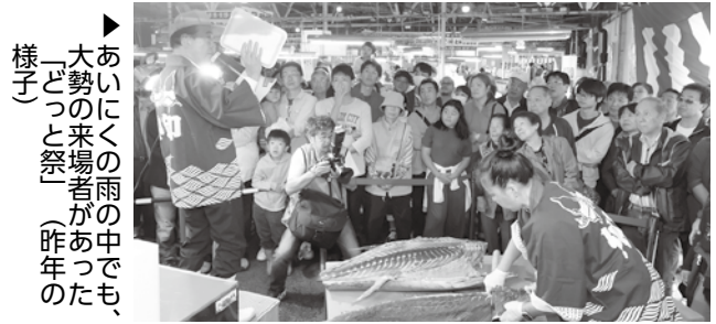
あいにくの雨の中でも、大勢の来場者があつた「どつと祭」(昨年の様子)