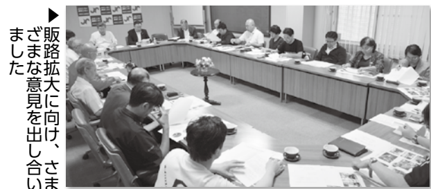
販路拡大に向け、さまざまな意見を出し合いました

実行委員会では、今回の企画会での意見を活かし、出展者とも協力しながら、さらに販路拡大に向けた見本市になるよう、企画していくことを確認しました。