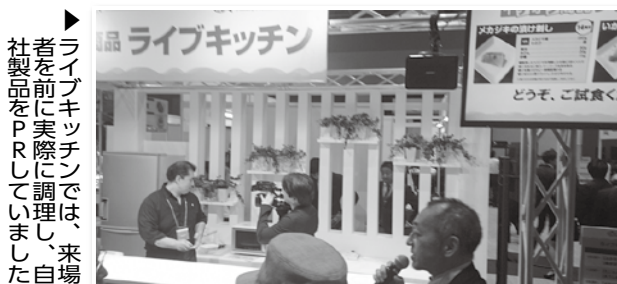
▶ ライブキッチンでは、来場者を前に実際に調理し、自社製品をPRしていました。

この事業は、6年間の予定で、来年最終回を迎えます。自立、自活に向けて、各社一層の努力が求められています。