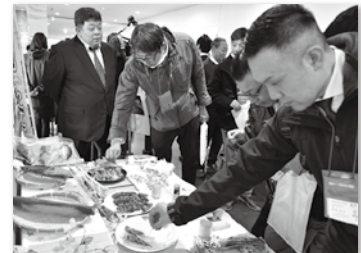
新魚市場での開催となった昨年の見本市

はじめに、事務局より事業の実施状況や成約状況などについて報告しました。特に商談成約数が63件で、昨年より19件増加したことや、既存取引先