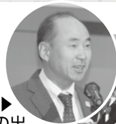
400名の出席者の中、六車会長が地区要望を発表しました

続いて、各地区から要望が出され、仙台・塩釜港区からは当所に事務局がある仙台塩釜港振興会の六