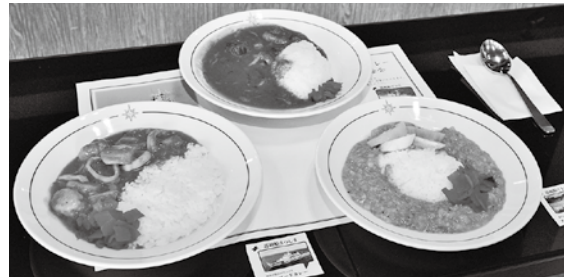
提供される3種類のカレー

委員長からは、このプロジェクトが塩竈の町興しを目的としていることや、カレーレシピの概要、申し込み以降のスケジュール、参加にあたってのルー