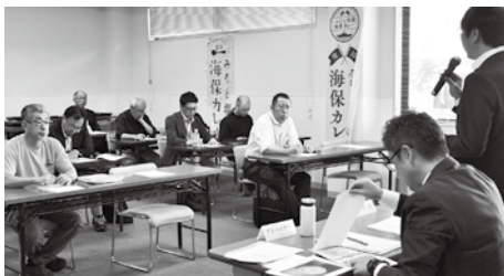
プロジェクトの内容についての説明を行いました

今後も、「みなと塩竈海保カレー」を提供できる店舗を広げていくために、第2次募集・第3次募集を行う予定です。ご興味のある方は、プロジェクト委員会事務局（TEL：022-367-5111）までお気軽にお問い合わせください。