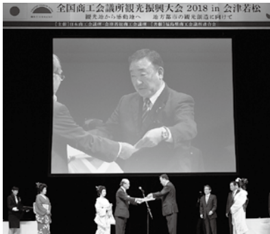
▲昨年受賞した「全国商工会議所観光振興大会」優秀賞に引き続き、さらなるシテイヤール契機に努めます

海・みなと、歴史や文化などができる事業を展開します。「みなと塩竈・ゆめ博」による交流人口の拡大、「塩釜みなとブランド」の育成、販路開拓支援、商業・観光資源の情報発信など、塩竈の特性を活かし、地域活性化に繋がる事業を展開します。