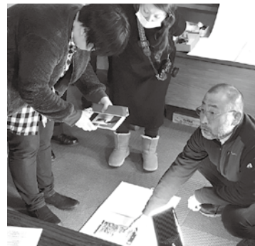
▲商人塾や創業スクールの実施など、創業支援に取り組みとともに、販路開拓など経営革新へ向けた事業を展開します