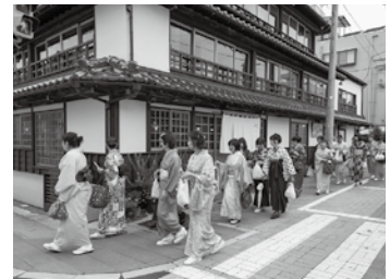
▲「みなと塩竈・ゆめ博」の開催を通して、新たな地域資源の発掘と交流人口の拡大を図ります