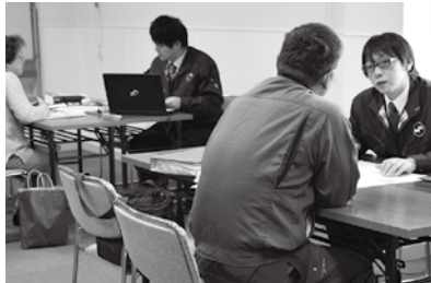
▲確定申告相談や無料法律相談など、会員に寄り添った経営支援を強化します

国から認定を受けた「経営発達支援計画」のもと、伴走型支援体制を強化します。専門家の派遣事業を活用し、公的機関の支援制度や施策等の情報提供などによって、小規模事業者の経営改善を図ると共に、販路開拓・拡大に向けた持続的経営や経営革新をサポートします。