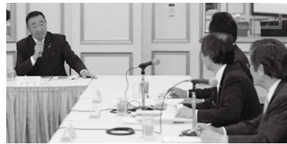
▼宮城県商工会議所連合会などを通して、制度的な課題を行政施策に反映させるよう努めます

会員ニーズの把握に努め、会員の声を行政施策等に反映させるよう、努めます。また、地域の発展に必要なインフラの整備や、商工業を取り巻く諸課題の解決に向け、関係機関等への政策提言や要望を行います。