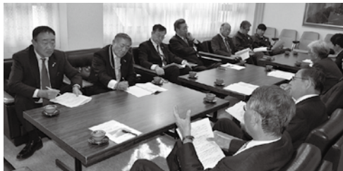
▲各部会からの意見をまとめた地域の課題を、塩竈市など関係機関へ要望します