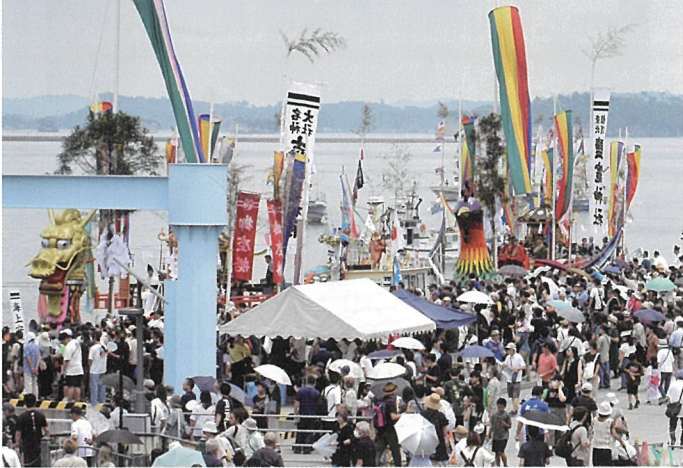
▲大勢の見物客に見守られながら御発船を待つ2隻の御座船