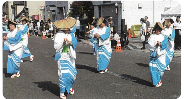
▼女性会は涼しげな浴衣で