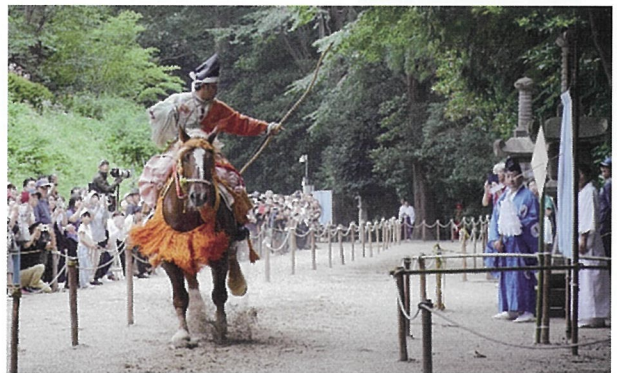
▲的中した矢の的は除災招福の瑞祥と言われています

例年、7月の第2日曜日に行われており、今年は塩竈みなと祭前夜祭と重なりました。多くの見物客の中、矢が的を射抜いた音が、境内に甲高く響いていました。