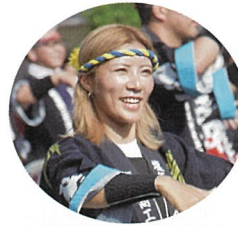
◀まぶしい笑顔がステキですね！