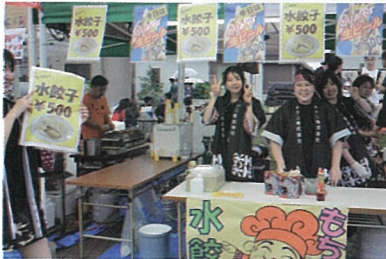
▲ウチの水餃子おいしいよ!