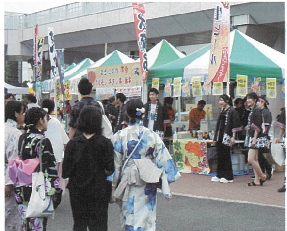
▲当所青年部が運営した「縁日広場」。明るい時間から多くの来場者でにぎわいを見せていました

7月15日、塩竈みなと祭が開催され、御神輿の海上渡御や陸上パレードが行われました。また、14日の前夜祭では、約8千発の花火が塩釜港の夜空を彩りました。当所青年部は、イオンタウン塩釜