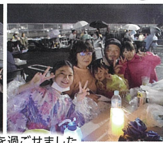
▲家族でいい時間を過ごせました