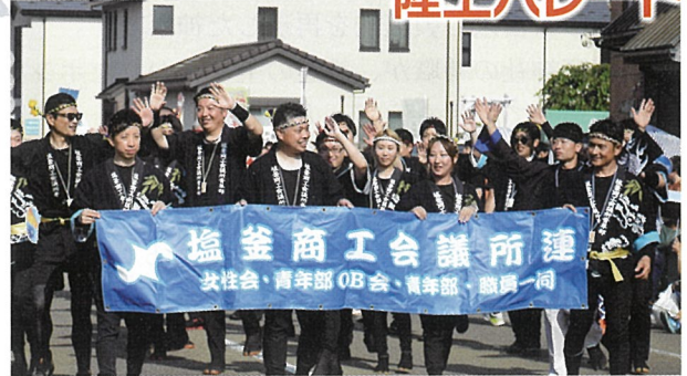
▲青年部、女性会、当所職員が「塩釜商工会議所連」女性会、青年部 OB会、青年部、職員一同陸上パレードに参加しました