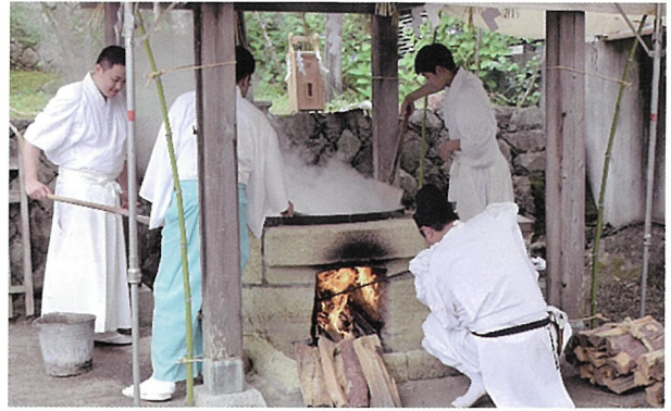
▲薪で火加減を調整し、釜の海水を煮詰める神職

藻塩焼神事は、4日に七ヶ浜町の花淵浜沖でホンダワラを刈取り(藻刈神事)、5日に釜ヶ淵で海水を