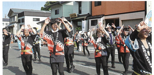
▲晴天に恵まれた陸上パレード。全員でゴールを目指し、踊りました