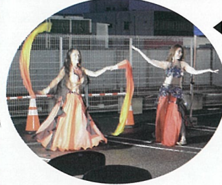
◀マイシャさんはベリーダンスを披露