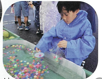
▶「スーパーボールたくさん取れたよ!」