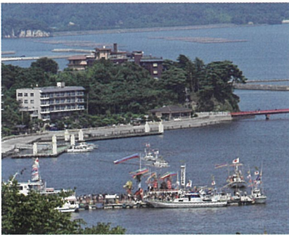
◀松島海岸に寄港する「龍鳳丸」。松島でも多くの見物客が出迎えていました