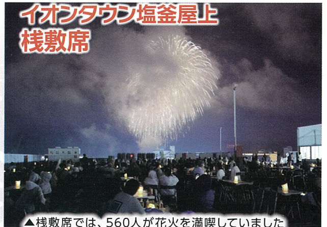
▲棧敷席では、560人が花火を満喫していました

▶今年にはマリングートの縁日広場でも行いました。多くの来場客でにぎわっていました。