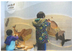
▲お魚のパズル。難しいけどやめられない!