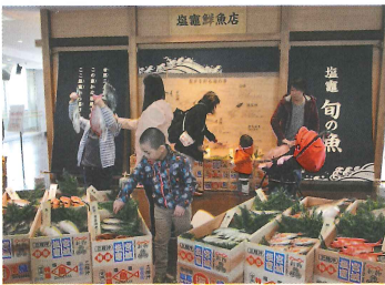
▲塩竈に水揚げされるお魚を模型で紹介しています

3月24日、塩竈市魚市場内(南棟2階)の展示スペースに「おさかなミュージアム(仮称)」がオープンしました。塩竈の魚、漁業・水産加工の3つのテーマで展示されています。魚屋の店先の再現コーナーやすし店カウンターのパッチャル体験コーナー、原寸大のマグロの模型展示等もあります。子供も大人も塩竈の基幹産業について、楽しく学べます。