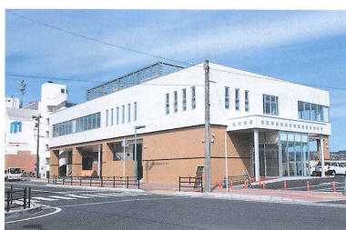
▲鉄骨2階建てで、研修スペースや離島支援センター等があります

北浜緑地の対岸、マリネット塩釜の東隣に、塩竈市津波防災センターが完成しました。 現在、オープンに向けて防災用品の備え付けや、被災状況や復興への取り組みを伝える展示物等の準備が行われています。