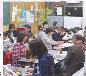
▲各自、様々な被写体を撮影。商品やサービスの魅力アップにつながる撮影を学びました