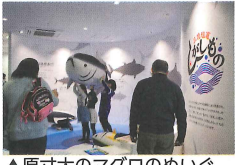
▲原寸大のマグロのぬいぐるみ。みんなまで持ち上げ、迫力満点