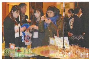
▲新メニューの試食ができる「しおがま屋」。番傘を使った和風の演出で、バイヤーをもてなしました

また、今回は昨秋完成した新魚市場の見学ツアーや、塩竈水産品協議会の協力による海外バイヤーとの個別商談もありました。また、出品された食材を使った新メニューの試食も大変好評でした。