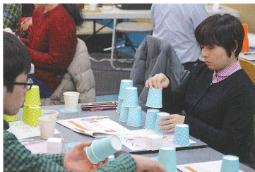
▲紙コップを商品に見立て、陳列の仕方やディスプレイを実践しました

販売促進に繋がるテーマで実施しました。全ての講座を受講することにより、販促ツールの作成から販路拡大の計画立案まで、学んでいただきました。参加者からは「明日から生かせる、販促の基本をわかりやすく学べました。また、商売に役立つヒントも得られました。お客様の心を動かせるようなお店づくりをしたい」と思っています」との声がありました。