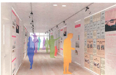
▲震災の記録や防災のポイント等のパネル展示コーナーのイメージです

▼備蓄倉庫には、約1,000人分の水・食糧毛布が常備しており、災害時の避難者受け入れに備えています