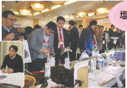
▲商談スペースでは、活発な商談が行われました

▲多くのバイヤーが来場し、熱気あふれる見本市となりました。各社の試食も大変好評でした。