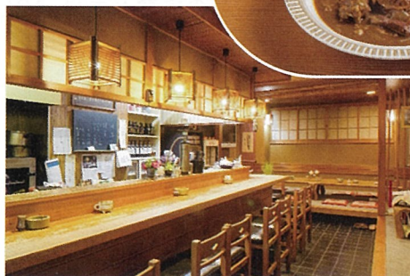
▲明るく、落ち着いた店内。食事やアルコールをゆっくり楽しめます