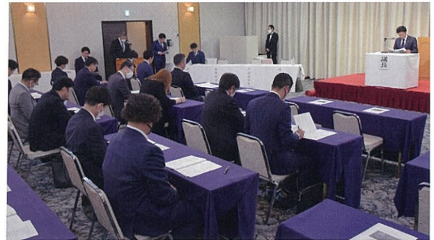
▲今年は役員改選も行われ、新体制が整いました

阿部会長からは、「9月に『しおがまさま神々の月灯り』を開催します。青年団体の力を結集し、塩竈の魅力を発信して、このイベントを成功へと導きましょう」と力強い挨拶がありました。