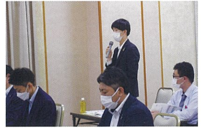
▲質疑も積極的に行われました

進、クリーンエネルギーの普及などに取り組む』ことを定めたものです。2030年为目标年となっています。すでに塩竈