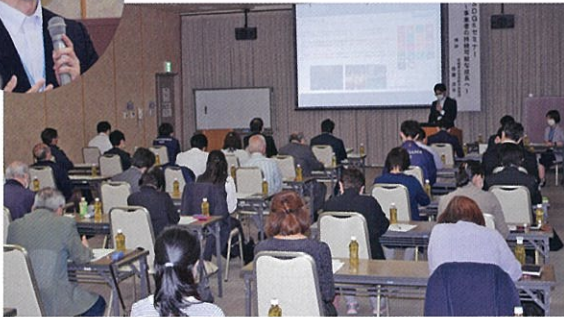
▲宮城県のSDGsの取り組みについて、参加者全員が真剣に聞き入っていました

進、クリーンエネルギーの普及などに取り組む』ことを定めたものです。2030年为目标年となっています。すでに塩竈