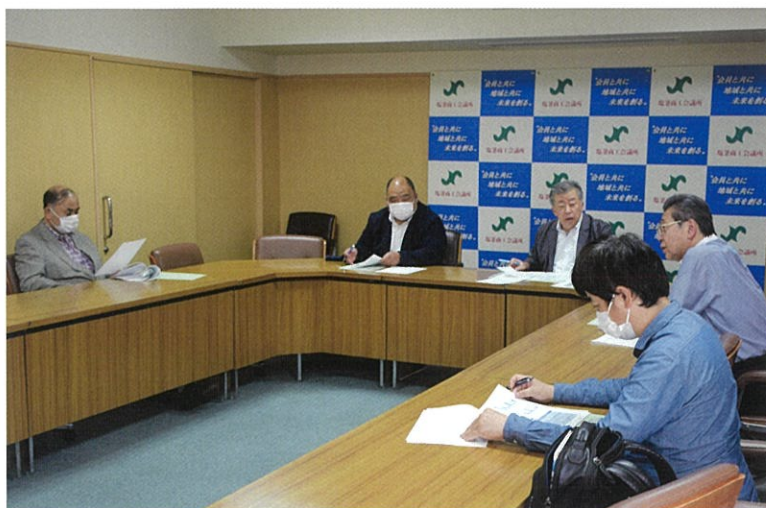
▲役員会では、積極的な意見が交わされました