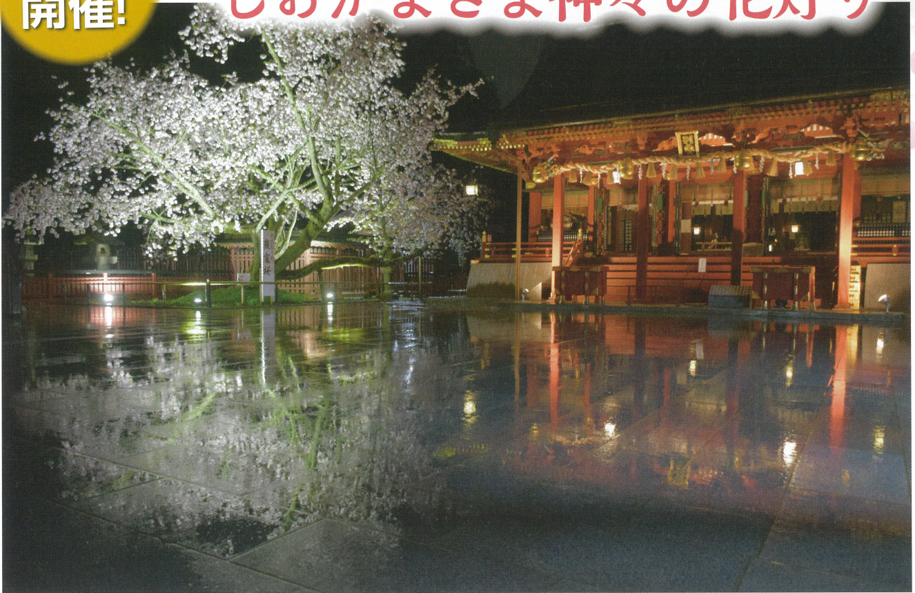
▲例年よりも早く開花した鹽竈ザクラが、神秘的な世界をつくり出していました

4月15日、志波彦神社・鹽竈神社境内で、『しおがまさま神々の花祭り』が開催されました。202段の表坂、朱色の拝殿などがLEDランタンの光に浮かび上がり、満開の鹽竈ザクラも小雨に濡れて風情が増し、境内は幻想的な雰囲気に包まれました。