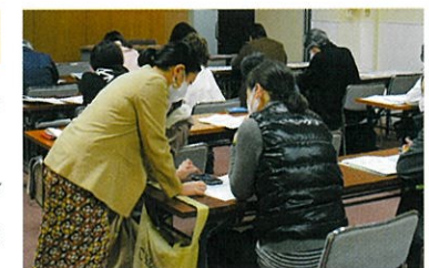
▲SNSの活用方法について、一人一人丁寧に説明いただきました

受講生の9割が女性でSNSへの関心が高く、「世の中の新しい動きをつくり出す女性の感性」を強く感じる講習会となりました。