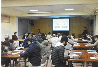
▲グループワークで積極的に意見交換をしました

「認知度拡大を目指すアンバサダーマーケティング」を学んでいただきました。「動画編集アプリの使い方」受講者からは、「難しいと考え敬遠してきた画像編集が、気軽にできることが分かりました」、「インスタでよく使われる専門用語についても、丁寧に解説いただいたので、分かりやすかったです」、「今後もSNSに関する講習会を開催してほしいです」との声がありました。