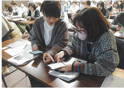
▲「この操作どうするの?」実践で疑問を解決しながら、学びました

本年3月、市内の商店主などを対象に、インスタグラムを活用した集客術を学ぶ「商人塾」を開催しました。これは塩竈市からの委託事業でインフルエンサーなどとして活躍されている方を講師に、利用時のポイントなどを解説いただきました。4回に分けての講座で、「インスタの仕組みや活用事例」、「画像の編集方法」、