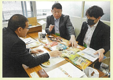
▲個別商談では、熱心に商品のPRを行いました。出展企業の6割近くが販路開拓につながりました

2月27日、塩釜市魚市場で、「塩釜フード見本市・みなとしほがま・海と社の商談会」を開催しました。バイヤーは、東京や岩手、県内を中心に、百貨店、スーパー、鉄道、航空、外食店などの17社となりました。出展者は、当所の29会員で、