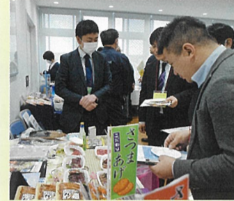
▲展示ブースでは、試食品も準備し、積極的なPRが行われました

らしい、塩釜の魅力も十分に味わっていただきました。出展者からの感想「インバウンド向けに開発した商品を出展しました。商談では好感触だったので、良い結果につながればと思っています。」