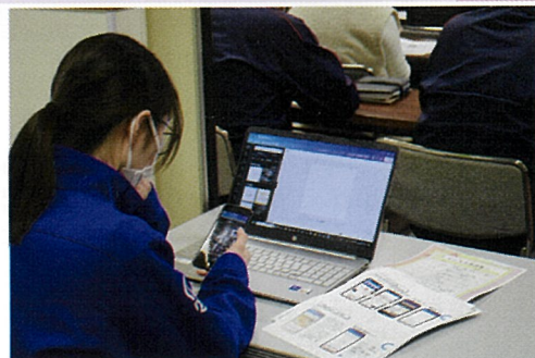
パソコンとスマホを同時に 操作しました 熱心に取り組んで