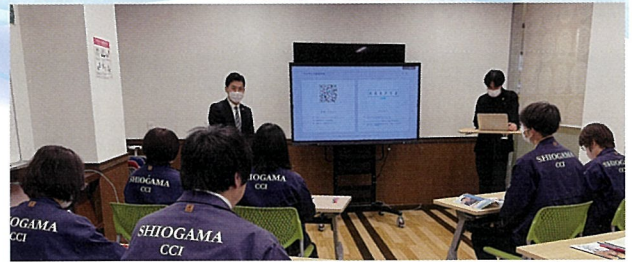
▲会議所業務のDXも進めます (写真：市内のIT企業で、DXを体験)

協議の結果、新年度は「次代へ向けた変革と地域経済の活性化を目指して」をスローガンとし、会議所業務のDXを推進すると共に、自己変革に挑戦する会員企業の支援や会員サービスの向上を目指すこととなりました。予算規模は2億6,881万円とすることになりました。