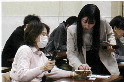
講師へ積極的に質問する 受講者の姿が見られました

受講者からは「なんとなく始めたInstagramが集客の要になることを実感しました。目的を設定して、チャレンジしていきたいです」、「お金をかけなくても、Instagramを活用する事で、大きい反響がいただけることが分かりました」との声がありました。