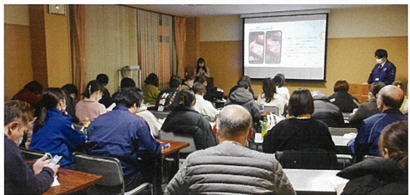
▲講師の説明に熱心に聞き入っていました