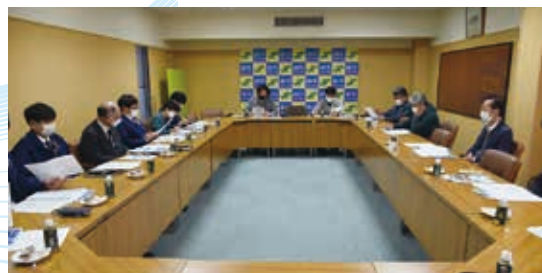
◀業界の現状について情報交換しました

振興委員からは、「エネルギー価格の高騰、原材料・資材、商品の度重なる値上げによる利益圧迫」、「観光需要の本格回復の遅れ」、「消費者の購入額の低迷」、「免税事業者のインボイス制度の認知度不足」、「補助制度の拡充を」など、それぞ