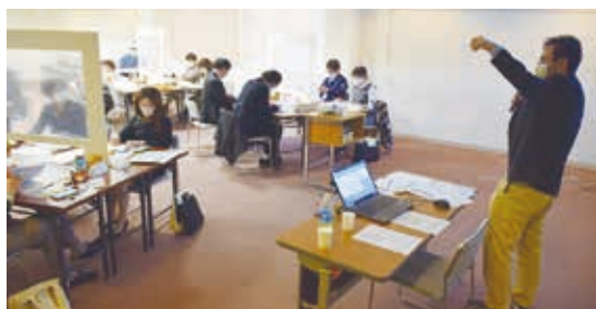
▲講師からは「こんな商品・サービスが欲しいと悩んでいる人と、それを提供しているあなたのお店がマッチングできるツールです。」と説明がありました

当所では、会員事業者の皆様のGoogleビジネスプロフィール登録を支援しています。希望者は、当所相談課までお問い合わせください。