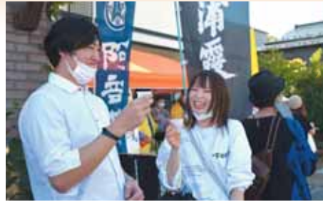
「日本酒が好きで、初めて参加しました。楽しく巡れたのでまた塩釜へ遊びに来ます」

3蔵すべてを巡った方は、本町くるくる広場で開催された「釜'sBAR」（塩釜小売酒販組合主催）で、日本酒などが当たる抽選会に参加したり、秋の新商品の試飲もできるとあり、市内外から多くの方が参加しました。思い思いに秋の塩竈を楽しんでいただきました。