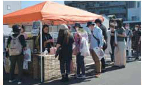
チケットが完売し、釜'sBARの抽選にも列ができていました