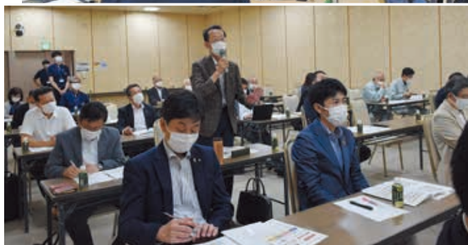
▲これからの塩竈について、出席者全員が真剣に聞き入っていました