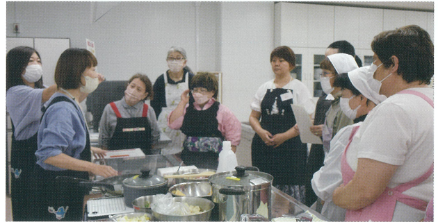
▲ホームアドバイザーから、家庭でもマネできるIHの便利な使い方を教えていただきました

また、電気料金や女川原子力発電所2号機における安全対策工事の現状などについても、説明があり