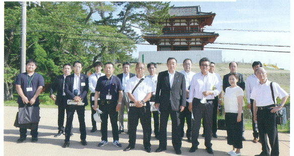
▲復元中の多賀城南門と築地塀を背景に。令和6年度に公開される予定です