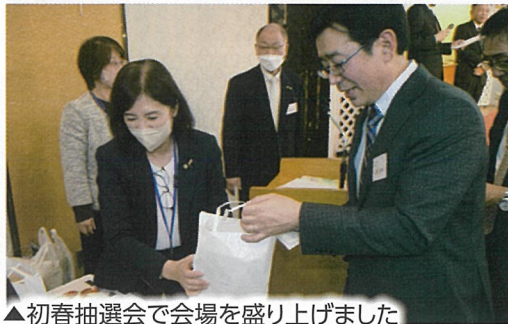
▲初春抽選会で会場を盛り上げました