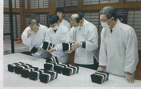
▲「例年よりも素晴らしい海苔だった」と講評がありました。また、「北限の海苔は全国でも早く出荷できる。宮城が誇る寒流海苔を全国へ届けるため、生産者には更なる工夫や努力を重ねてほしい」と激励の言葉が添えられました。

1月6日、塩竈神社で第76回奉獻乾海苔品評会がありました。県漁協10支所から92点が出品され、規定重量の計量後、色つやなどの品質について審査が行われました。