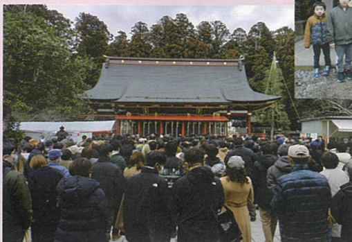
▲塩竈神社境内にある大絵馬。多くの家族連れが記念撮影をしていました

塩竈神社に多くの参拝客の姿がありました。新型コロナウイルスが5類になってから初めての初詣ということもあり、にぎわいを見せていました。また、市内の初売りでは、景品を充実させた抽選会や割増商品券、福袋の販売が見られました。