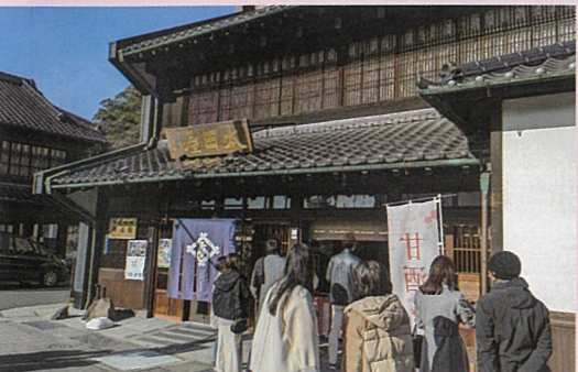
▲市内の老舗には行列ができていました