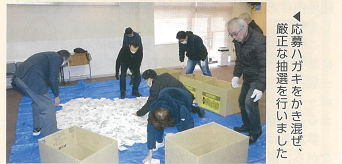
▲応募ハガキをかき混ぜ、厳正な抽選を行いました