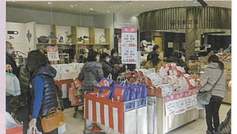
▲小売店では福袋目当てのお客さんが多く訪れていました

▲神社の関係者は、「年々朝早くから行動する人が減ってきており、お昼以降からの参拝客が増えてきたようです」と話していました