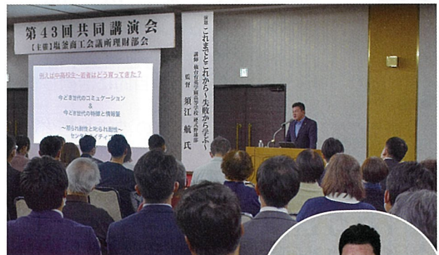
▲全国から講演依頼が絶えない監督のお話に、参加者は顔きながら聞き入りました

須江監督は、「今の若い世代には、答えを与えるのではなく、一緒に考えてモチベーションを上げる関わり方をしてみてください。どんな状況でも、自分の気持ちや考え方をコントロールすることができれば、問題を乗り越えることができます。挫折のない人生なんて存在しません。何度失敗しても出来ない