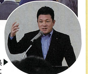
▶若い世代との接し方を熱く語っていただきました