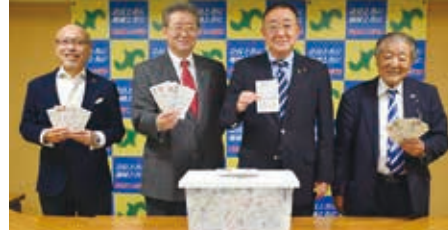
◀方抽選で105名の当選しました

市制施行80周年記念「みなと塩竈・ゆめ博」事業として、「食べて！買って！使って！当てよう！塩竈元気スタンプラリー」を実施しました。2店利用すると応募ができる企画で、応募総数は4,134通となりました。