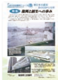
▶▶震災の記録としても貴重なものとなりました

会議所ニュースやホームページ、マスコミ活用による情報発信機能を強化し、加入勧奨と退会防止に努めました。また会議所ニュースに7回にわたり「東日本大震災から10年・再生から創生への歩み」を連載。各業界の発災時の状況や復興に向けた取り組みを特集しました。