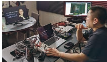
▲29名が参加したオンラインで開催した「塩電商人塾」