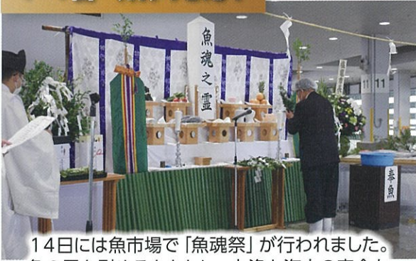
14日には魚市場で「魚魂祭」が行われました。魚の霊を慰めるとともに、大漁と海上の安全を祈願しました