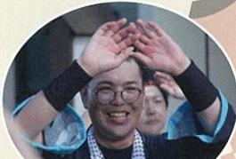
猛暑の中、笑顔で乗り切りました！