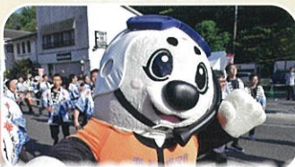
海上保安本部の「うみまる」（写真左）と第一小学校の「アマビエ」が、暑い中一生懸命踊っていました