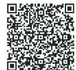
伴走型支援事業 (宮城県)