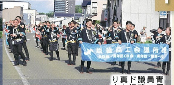
青年部・女性会・アカサ推進員・当所職員が「塩釜商工会議所連」として、陸上パレードに参加しました。女性会（写真左）は涼しい浴衣で踊りました