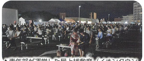
▲ 青年部が運営した屋上 まじきせき 敷席（イオンタウン塩釜）には、今年初めてペア席も設置、多くの人が楽しんでいました。また、来場者からは「小さな子供とゆっくりと安心して花火を楽しむことができました」と好評をいただきました