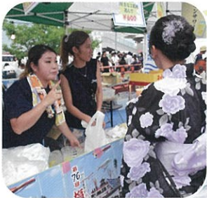
今年は天候に恵まれ、ビールやサワー、かき氷が飛ぶように売れました