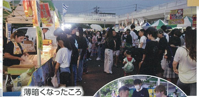
薄暗くなったころにはもう行列が