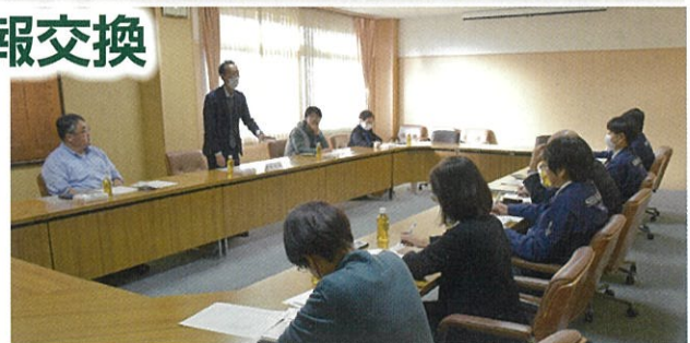
▲各委員から業界の現状について報告がありました

その後、振興委員からは「免税事業者のインボイス制度の認知度不足」や「この夏の猛暑による海産物への影響」、「エネルギー価格の高騰、原材料・資