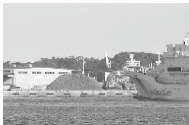
▲塩釜港の早期の利活用が求められます

要望に対する市からの回答については、具体的な課題解決への取り組みなどが示されるよう、今後も継続して要望していくこととなりました。