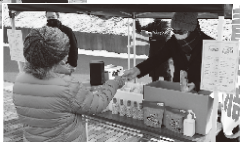
▼ 少しの会話がひとときの和みの時間に

今年創立40周年を迎える青年部は、コロナ禍でも地域を盛り上げる活動を続けています。