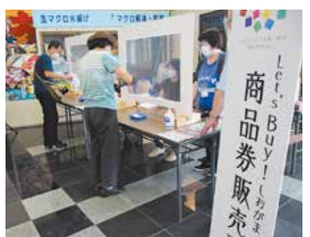
▲8月の販売も大盛況でした

12月16日から、5,000円で10,000円分の買い物ができる「Let's Buy & Eat! しおがま商品券」を販売します。これは、新型コロナウイルス感染症の影響を受けている小規模店舗と市民生活の支援を目的とした第2弾の企画で、塩竈市と共に発行します。なお、今回は10,000円の内3,000円が飲食店専用券となります。