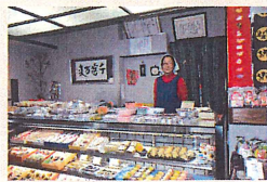
▲店頭では、華やかな和菓子と明るい女将がお出迎え

初代が本町に店を構えて130年が経ちました。当初は、「さかえや」の屋号で旅館屋をしていました。そこで、和菓子、パン、水あめ等も製造、販売していました。その後、旅館屋をたたみ現在の和菓子店「梅果堂」となりました。店名にある「果」の由来は、和菓子の材料に果物もあるということと、果物は実りの縁起物なので、お店が繁栄するようにという思いが込められていると聞いています。