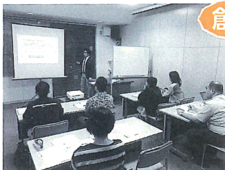
▲これまでの受講生からは、ビジネスプランを実現し、開業された方もいます

金計画の立て方、ビジネスプラン作成などです。講師は中小企業診断士や社会保険労務士の他、各分野の先生方です。