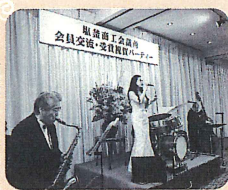
▲塩釜にちなみ、塩釜甚句の演奏もありました

当所では、日々の経営相談から補助金申請まで様々な相談業務を行っています。お気軽に当所相談課(TEL022-3671511)までご相談ください。