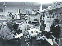
▲これまで、実行委員一同会議を重ね、準備をしてきました

きらり輝き観光振興大賞 「優秀賞」を受賞 地域資源の掘り起こしによる シティーセールスが評価 みなと塩釜・ゆめ博