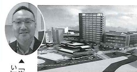
▲再開発イメージパース

海岸通地区再開発計画では、1番地区に14階建てのマンション（1階が専門店）、4階建ての業務棟、120台収容の立体駐車場を建設。2番地区は、2階建ての飲食店など、「食」を中心とする商業施設が配置されます。総事業費は44億1,000万円。 再開発組合では、権利変換手続きを進めており、早期の工事着工を目指しています。