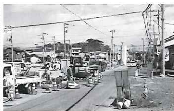
▲整備が進む藤倉地区

藤倉二丁目では、道路拡幅や宅地のかさ上げ、ライフラインの整備などが急ピッチで進んでいます。 4月から地権者への宅地の引き渡しが始まっており、年度内に全ての引き渡しが完了します。